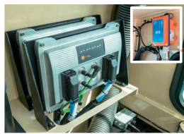
コントローラ (右上 受信機)

運転席内のコントローラで操作信号を一括制御することで、走行や掘削など全ての操作をラジコンで行うことが出来ます