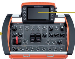
ラジコン(3.5kg) 5インチのディスプレイを搭載