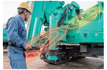
機械周囲を目視しながら操作