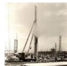
世界初の三点式杭打機