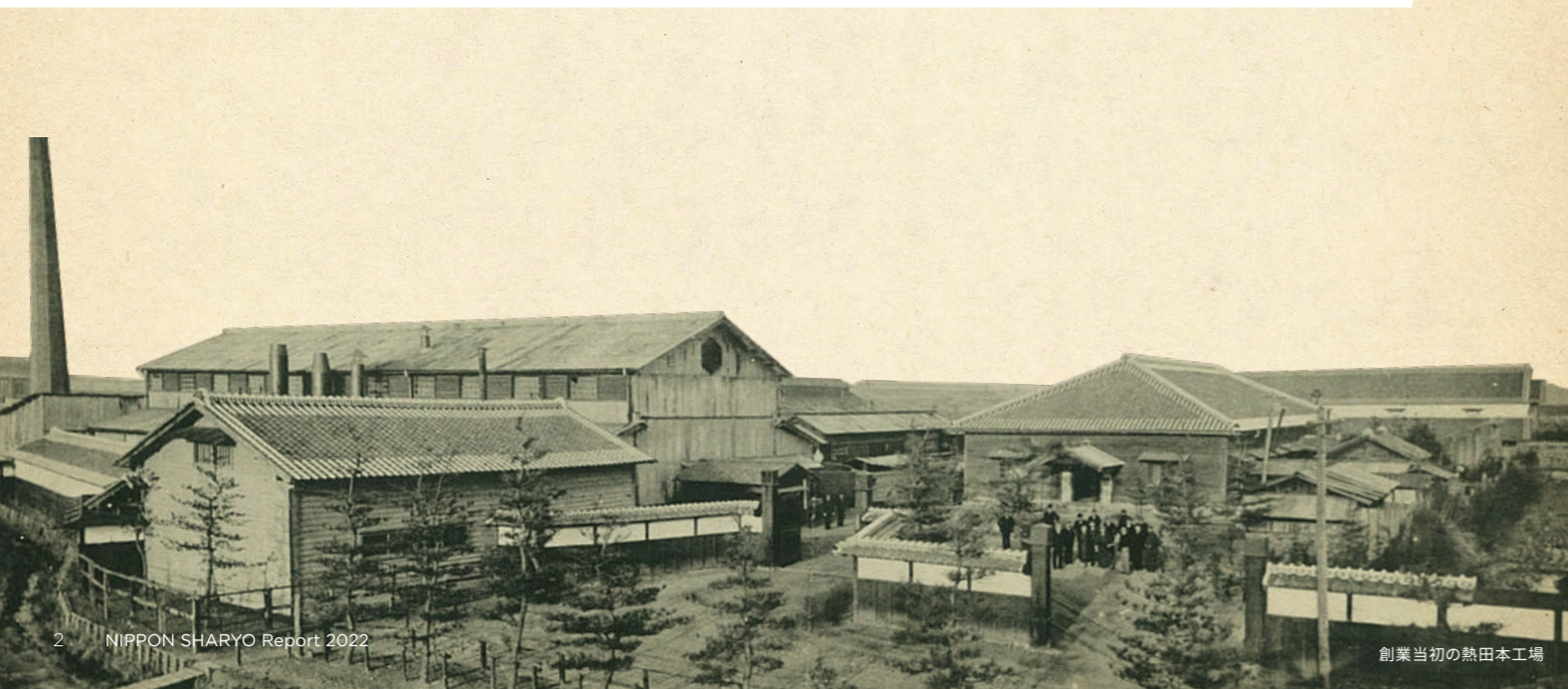
創業当初の熱田本工場