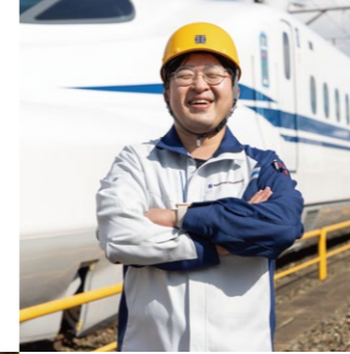
Transportation Equipment and Steel Structure